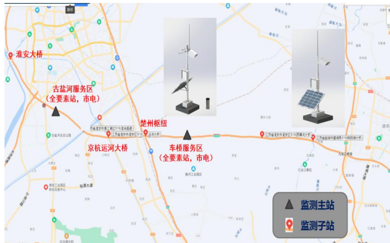
图 赴宿淮盐公司调研除雪防冻系统